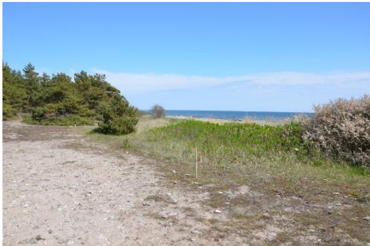
innan grävning: snår av vresros, markerat med käppar

Ett antal informationsskyltar sattes upp, både de allmänna om martorn och specifika om de aktuella åtgärderna. Stranden är ett omtyckt strövområde, och under sommaren även välbesökt av campare m.fl.