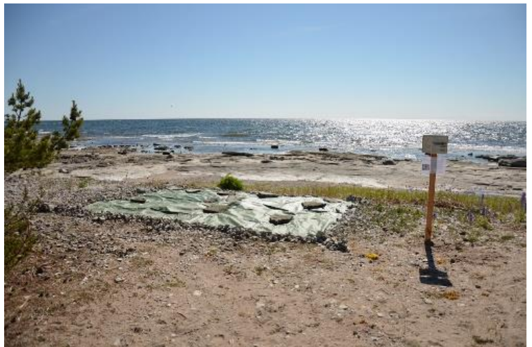
vresros täckt av presenning