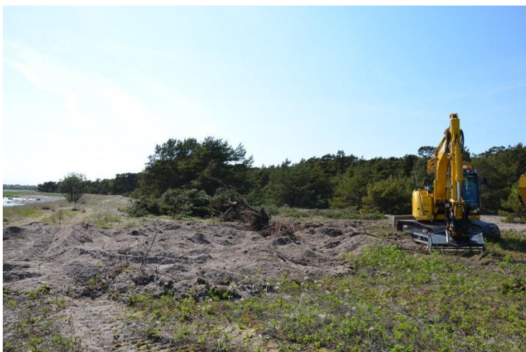
unga tallar är fällda och grävarbete pågår