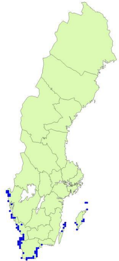
martorn: aktuell känd utbredning i Sverige

Den är en rödlistad art i Sverige. Hotkategori i aktuell rödlista är starkt hotad (EN), och så har det varit länge. Förekomsterna ligger långt från varandra, och på de flesta håll har antalet plantor minskat fortlöpande. Det är alltså prioriterat att förbättra livsbetingelserna för växten. Den är fridlyst i hela landet. 2009 publicerades ett åtgärdsprogram för hotade arter, för martorn. 2013 lades en reviderad lista över åtgärder till (Naturvårdsverket 2009).