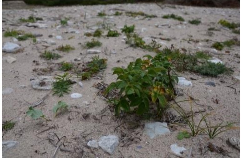
rotstumpar av vresros som blivit kvar efter grävning skjutit skott

ArtDatabankens databas för artfakta. Naturvårdsverket. 2009. Åtgärdsprogram för martorn 2008-2012. Rapport 5940.