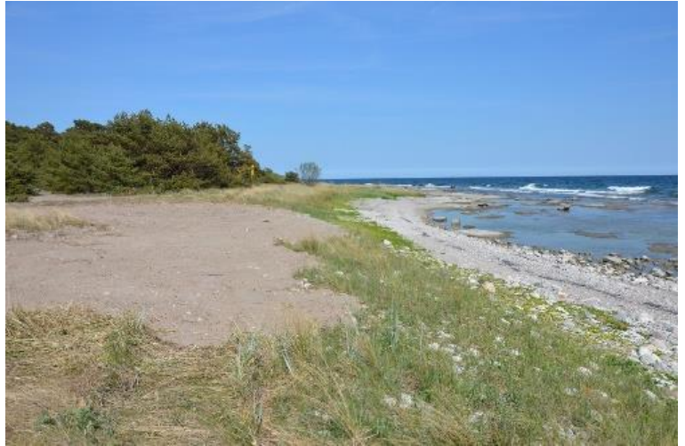
efter grävning: en blottlagd sandyta

Ett antal fotografier har tagits under processen. Under grävarbetet i maj gjordes ett inslag i lokalpressen ( Gotlands allehanda , 24 maj).