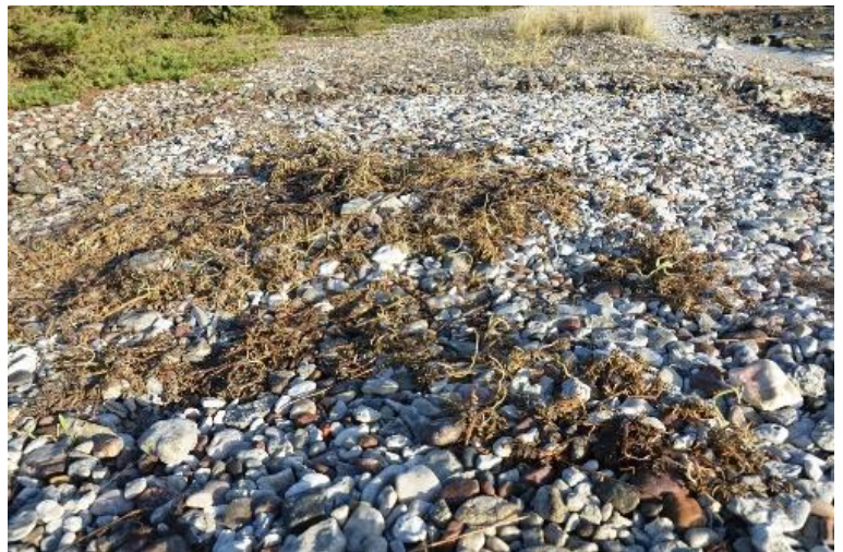
vresros som varit täckt av presenning under växtsäsongen